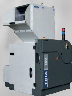
BM Series BM 3530 BM 5030 BM 7030