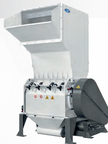
BM Series BM 7060 BM 11060 BM 16060