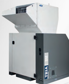
BM Series BM 6042 BM 9042 BM 12042